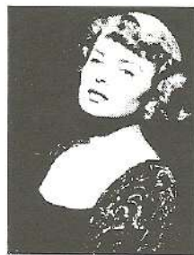
ΕΞΩΦΥΛΛΟ: 'Ινγκριντ Μπέργκμαν